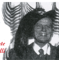
5° Presidente Bers. Alfiero Ciulli