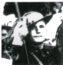
2° Presidente Bers. Raffaello Badalassi