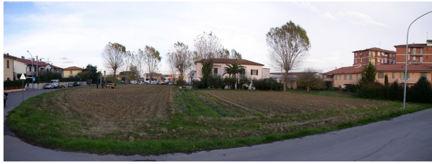
Foto 3: Panoramica dell'area oggetto del Piano attuativo di lottizzazione con ubicazione della CPT2